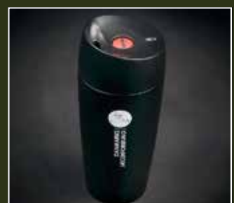
Termokrus 0,4 l. i sort med DJ logo