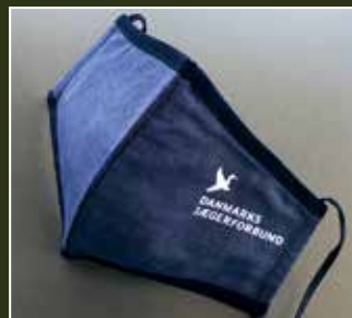
Mundbind i 3-lags stof, vaskbart med DJ logo