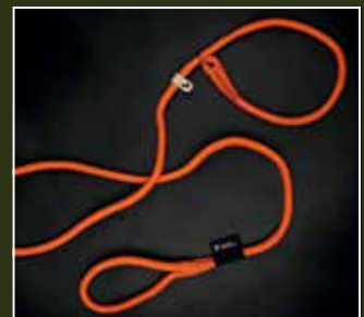
Retriever hundesnor 190 cm med DJ logo