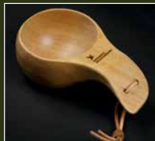
Kuksa kop "Nak & Æd" i træ, 1,2 dl m/ DJ logo