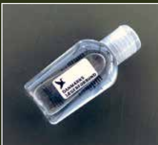
Håndrens gele 70%, 35ml, med DJ logo

Her er et lille udvalg af de mange varer, som medlemmerne kan købe i webshoppen.