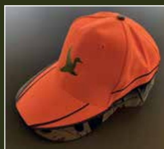
Orange camouflagede cap med DJ logo