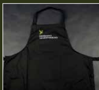
Forklæde i sort med DJ logo

Ved bestilling vil der blive tillagt kr. 45,- til dækning af ekspeditions- og forsendelsesomkostninger i forbindelse med betaling.