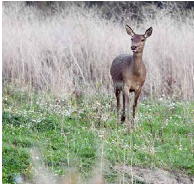
I jagtsæsonen 2021/2022 blev der totalt nedlagt 9.605 kron dyr.