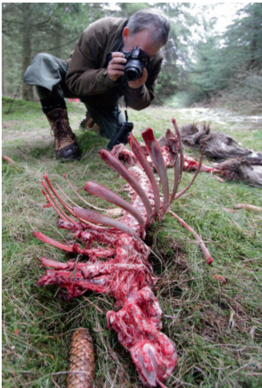
Ifølge fødeundersøgelser fra Tyskland udgør krondyr cirka 20 procent af føden, mens vildsvin tegner sig for 17 procent. Denne dræbte hind - fra St. Hjøllund Plantage - blev bogstaveligt talt pillet helt ren.