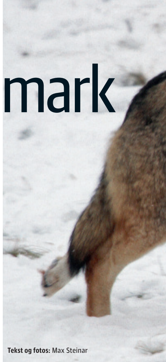
Tekst og fotos: Max Steinar

DEN FØRSTE SØNDAG i oktober 2012 blev der set en ulv i Hanstholm Reservatet. Det var IKKE den første ulv, der blev set i Danmark i nyere tid (se faktaboks). Men for første gang blev der i større kredse fæstnet lid til observationen, som blev gjort af en gruppe erfarne ornitologer, heriblandt også nogle med jagttegn. Og den ene af dem tog de fotos, som fik folk i bl.a. Naturstyrelsen til at nikke godkendende til, at der var tale om en ulv (hvilket blev bekræftet, da den blev fundet død af sygdom kort tid efter).