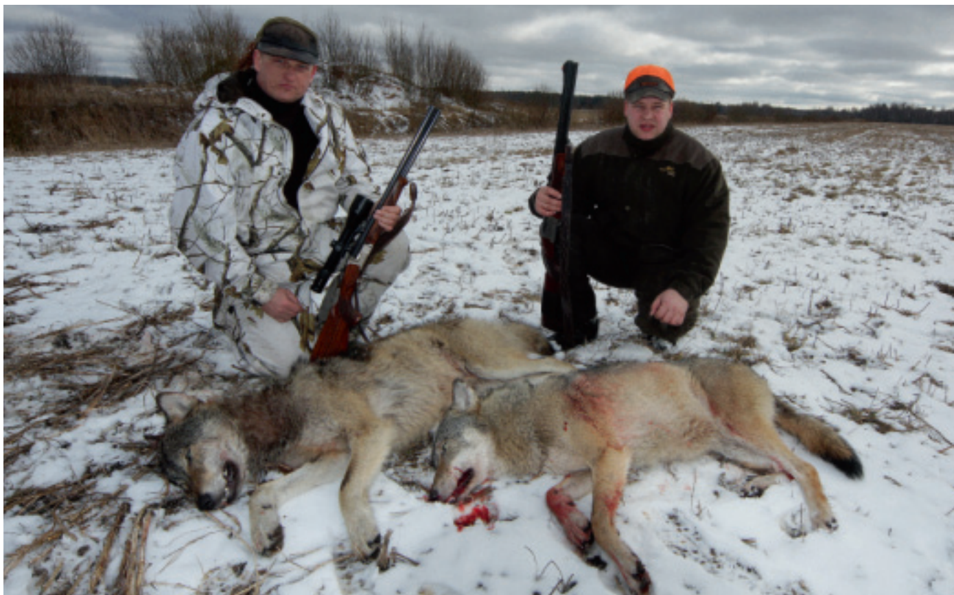
Letland oplever i disse år en massiv indvandring af ulve fra Hviderusland og Rusland. Dette foto er fra slutningen af marts 2014. Letterne - som har en kvote på ulv - nedlagde næsten 300 ulve i sæsonen 2013/14. Heriblandt dette unge par.