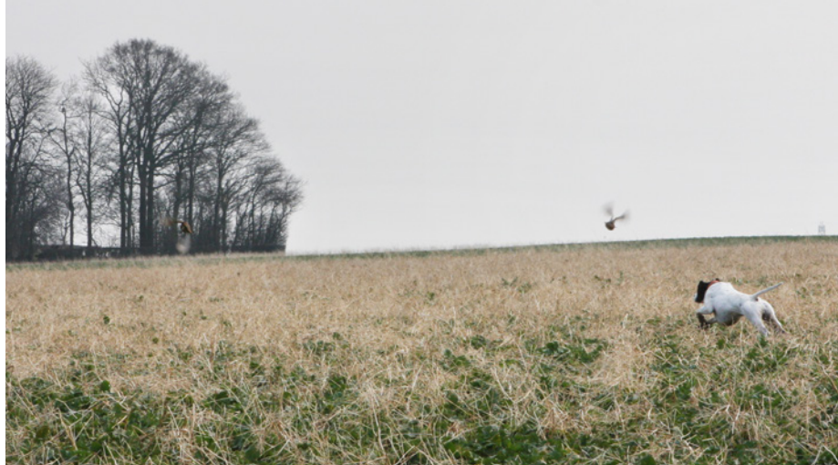
En klassisk jagsituation fra agerlandet, som vi også meget gerne skulle kunne opleve i fremtiden.

I 2014 startede projektet "Økologisk rum og biodiversitet", hvor der i 20 markvildtlav blev udført en grundig terrænregistrering, hvor eksisterende landskabselementer blev indtegnet og klassificeret. Projektet har blandt andet til formål at give indblik i, hvilke typer terrænelementer der øger biodiversiteten bredt set, og om vildtplejen har en positiv effekt på andet end bare vildtet. Hos udvalgte lodsejere har biologer fra DCE været på besøg for at tage jordprøver og indfange insekter.